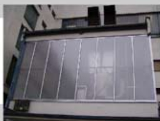
PC 4 10/16 mm