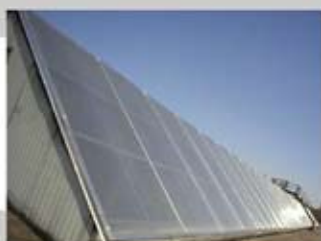
PC 3 10/16 mm