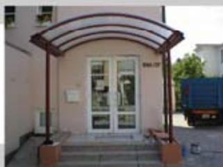
PC 6/8/10 mm