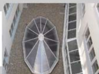
PC 5 20/25 mm